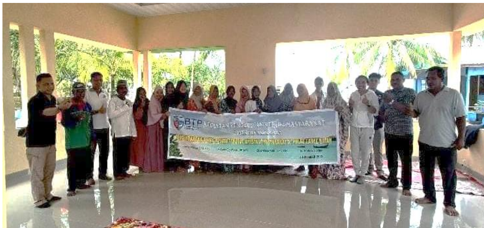
Gambar 3. Warga dan peserta Pengabdian

Kegiatan pengabdian Sidik, M., & Silitonga, F. (2021) di Pulau Lance telah berjalan dengan baik. Hasil dan target yang dicapai menunjukkan adanya animo yang sangat kuat bagi peserta pelatihan. Dengan pemberian materi tambahan CHSE serta pengembangan promosi wisata dan promosi produk dan hasil tangkapan nelayan sebagai media promosi telah berdampak pada peserta pelatihan Langkah awal pelaksanaan PKM ini adalah dengan melakukan koordinasi dengan mitra dalam hal ini adalah Pak RT dan perangkat Pulau Lance. Berikut adalah dokumentasi pelaksanaan koordinasi awal di tempat pertemuan warga, Pak RT dan perangkat Pulau Lance.