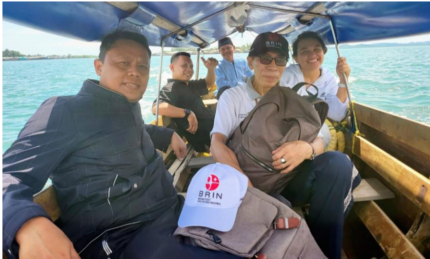
Gambar 2. Peserta Pengabdian menuju Pulau Lance untuk melakukan Survey

Wisata Program Pengabdian Masyarakat Mahasiswa dan Dosen Politeknik Pariwisata Batam: Focus Group Discussion bertemu dengan masyarakat pengurus Pokdarwis serta masyarakat yang benar-benar dapat merasakan kebutuhan Pulau Lance.