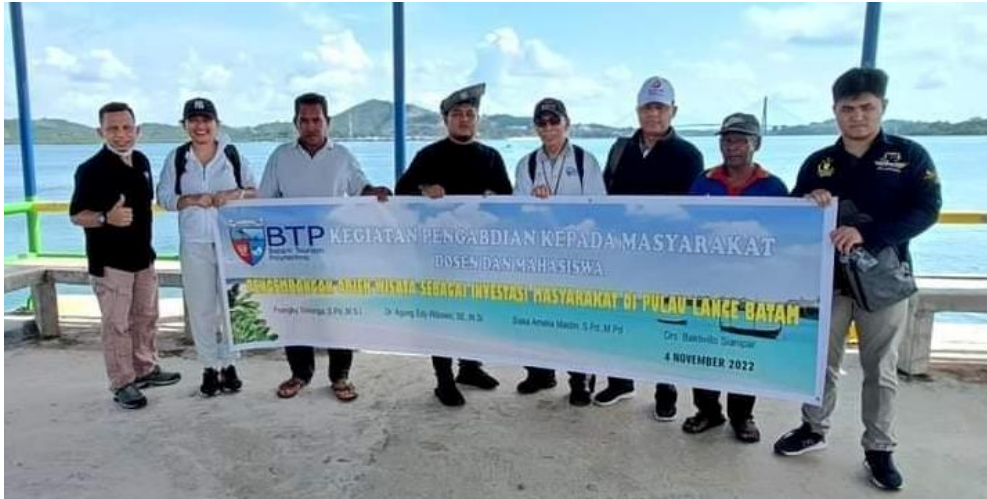
Gambar 4. Pak RT, Tokoh Pemuda dan peserta Pengabdian

Konsep tempat peristirahatan (rest area) adalah kursi beton dengan atap pergola dengan kayu untuk menimbulkan kesan natural dan menyatu dengan alam laut di Desa lance.